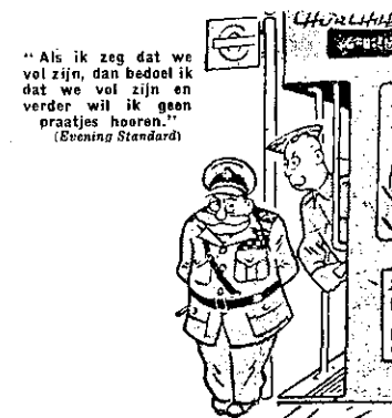
"Als ik zeg dat we vol zijn, dan bedoel ik dat we vol zijn en verder wil ik geen praatjes horen." (Evening Standard)

ADRESSENBESTAND Stichting Genootschap Engelandvaarders Aanvulling no. 5 per 1 maart 1984, toe te voegen aan de adressenlijst van de "Schakel" no. 16 van december 1982.