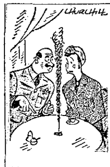
Nou, kijk-ees: laten we nou zeggen, dat dit Berlijn is... "Evening Standard," London

De in dit blad opgenomen cartoons zijn ontleend aan VRIJ NEDERLAND.