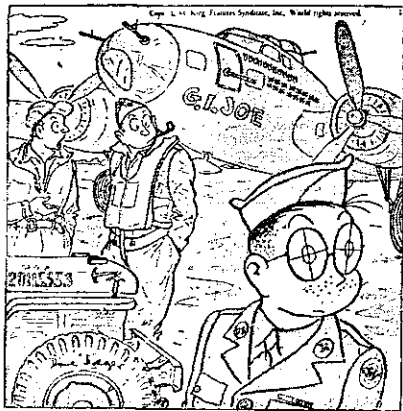
"Hij is in training voor bommenrichter." (Stars and Stripes)

Degenen die reeds een speldje besteld en betaald hebben vóór 1 januari 1984 zullen we niet met een navordering belasten. De nieuwe speldjes zijn te leveren vanaf de 2e helft van april 1984.