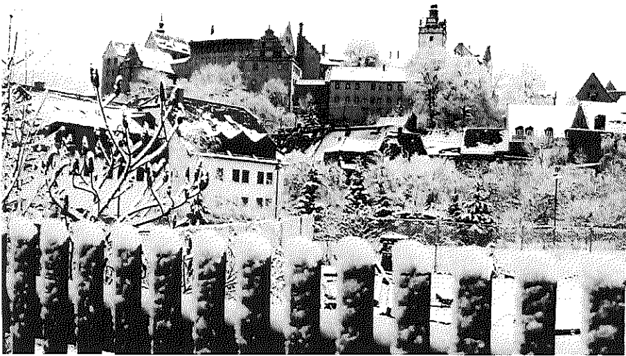
Het Schloss Colditz is voor het eerst in de annalen genoemd in het jaar 1014 als een jachtslot van de koning van Saksen. Sindsdien is het vaak van eigen(a)ar(es) verwisseld en werd voor de meest uiteenlopende doeleinden gebruikt. Van 1940 tot 1945 werd het door de Wehrmacht gebruikt als Sonderlager OFLAG IV C, een bijzonder streng bewaakt kamp voor krijgsgevangenen geallieerde officieren.