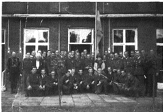
Engelandvaarders reünie in Engeland tijdens bezoek aan Koningin Wilhelmina en daarbij de uitreiking van onderscheidingen.

Een aantal Nederlanders was in Engeland toen de eerste berichten over een aanval bekend werden. Een aantal die op het punt stonden terug te keren na een zakenbezoek, realiseerde zich dat ze Nederland niet zouden weerzien gedurende de daaropvolgende oorlog.