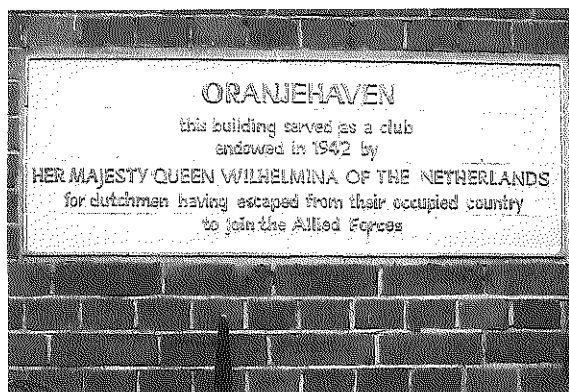
De vermelding op de gevel van het gebouw dat Oranjenhaven hier gevestigd was.

moelijkheden met de geallieerde mogelijkheden. Het moet gezegd worden dat Koningin Wilhelmina en Minister Gerbrandy hier geen last van hadden. Het is Gerbrandy geweest die overal als eerste alles wilde weten en daarom een politiek voerde die van veel waarde is geweest voor Nederland. Het laatste deel van het boek is