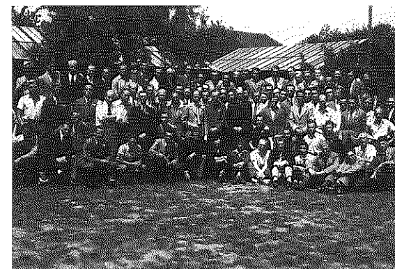
De vele Engelandvaarders bijeen in Cossonay, Zwitserland tijdens het bezoek van de Gezant en de Militaire Attache.