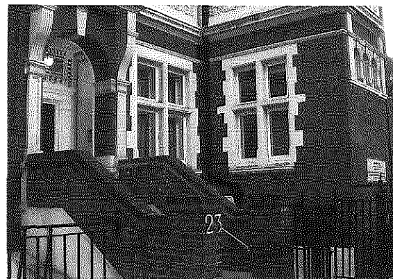
Oranjevaven in 2004, het gebouw.

Het boek leest gemakkelijk en geeft vele details over het leven daarna onder de bombardementen van Londen tot de jaren daarna. Van der Zee beschrijft in zijn boek de wereldvreemdheid van de Ministers en de moeilijkheden ondervonden. Het was natuurlijk wel zo dat