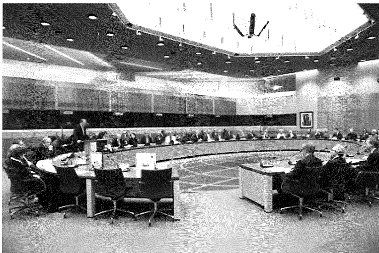
Van Kleffens-zaal in het ministerie van Buitenlandse Zaken