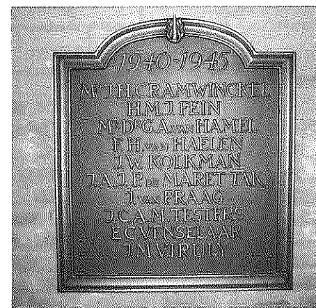
Herdenkingsplaquette, Ministerie van Buitenlandse Zaken